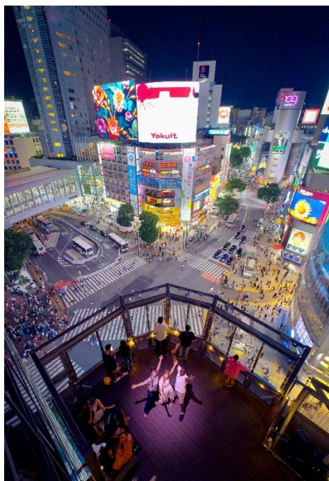
<ドローンフォトで撮影（昼・夜）>