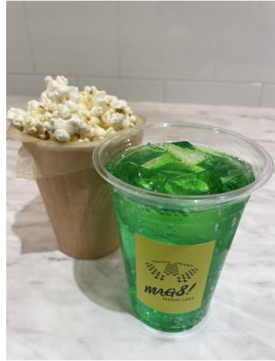
メロンソーダ：500円 ポップコーン：500円