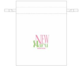
オリジナル巾着イメージ

その他、SHIBUYA109渋谷店に館内では本キャンペーンオリジナルリーフレットを配布いたします。