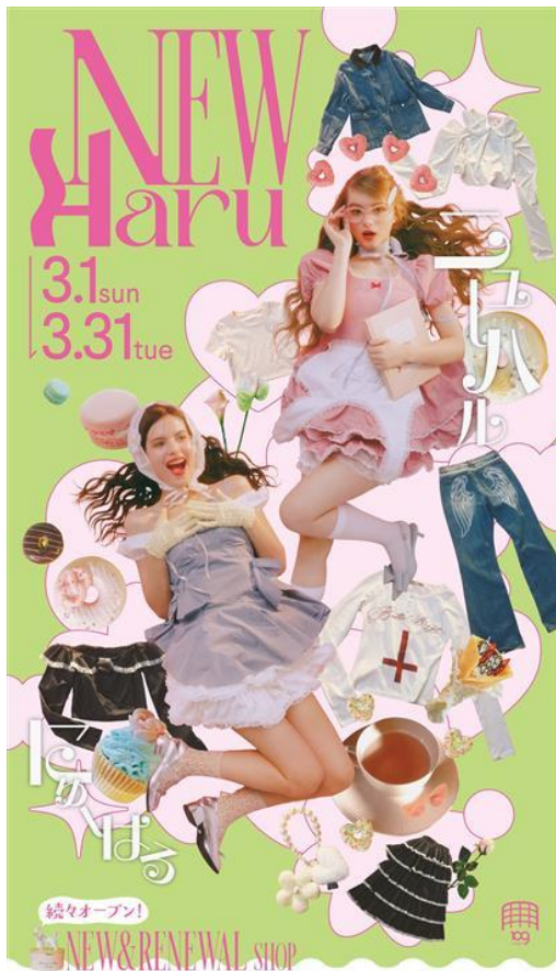
ニューオープン&リニューアルオープン店舗一覧

SHIBUYA109渋谷店では、『NEW Haru』をテーマにこの春を彩る心弾むファッションやトレンドを続々と発信してまいります。新店舗・リニューアル店舗の詳細および各種キャンペーン情報は、次頁以降をご覧ください。