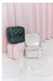
ノベルティイメージ