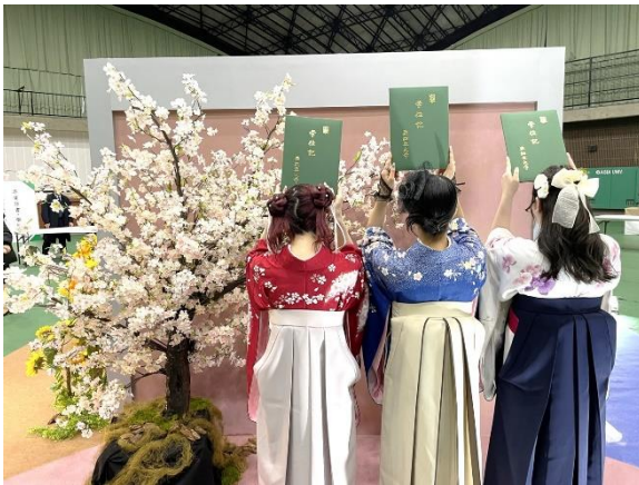
亜細亜大学様フォトスポット

今般、亜細亜大学（2025年3月15日実施）および東京都市大学（2025年3月19日実施）の2校において、卒業式の特別イベントとして「フォトスポット」をプロデュース。学生の思い出に残る瞬間を演出し、卒業という人生の節目をより感動的に彩る企画を実施いたしました。