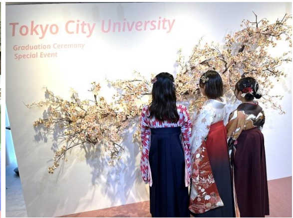
東京都市大学様フォトスポット