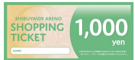
お買物券イメージ