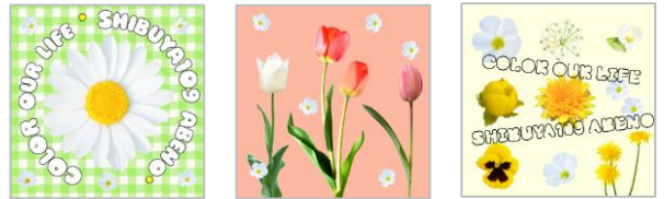
オリジナルチロルチョコイメージ （ミルク味・ホワイト&クッキー味）