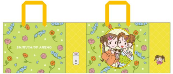
オリジナルショッパーイメージ

配布期間： 3月20日（木・祝）～4月6日（日） 対象店舗： SHIBUYA109阿倍野店対象店舗のみ