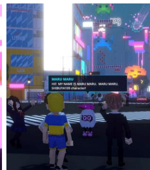
The Sandbox「SHIBUYA109 LAND」メタバース