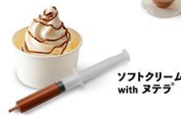
ソフトクリーム with ヌテラ®