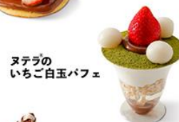
ヌテラのいちご白玉パフェ