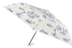
ノベルティイメージ

30,000円 (税込) 以上お買い上げで「オリジナルプリント折り畳み傘」をプレゼント。