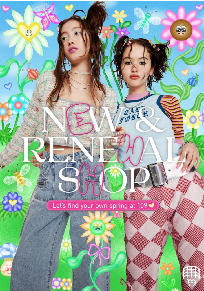
NEW & RENEWALオープン店舗一覧（一部）

製造企業が生産した商品を、小売店等をはさむことなく、消費者へ直接販売する取引形態のことを指す。