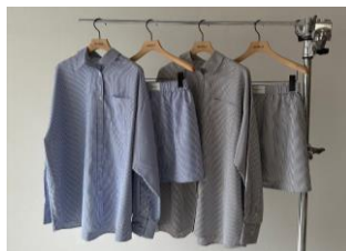
ノベルティイメージ

16,000円(税込)以上お買い上げで「トラペゾイド2WAYバッグ」をプレゼント。