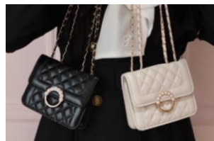
ノベルティイメージ

10,000円（税込）以上お買い上げで 「キルティングショルダーバッグ」を先着100名様にプレゼント。