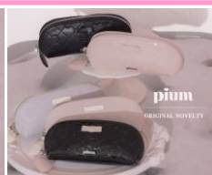
ノベルティイメージ