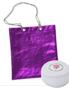
ノベルティイメージ

22,000円(税込)以上お買い上げで「Bluetoothスピーカー」をプレゼント。