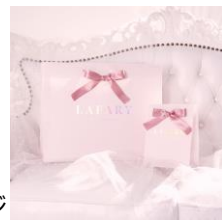
ノベルティイメージ