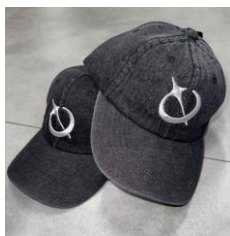
ノベルティイメージ