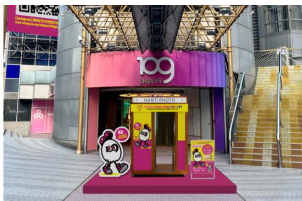
フォトブースイメージ

実施内容：キャラクター「マルマル」オリジナルフォトフレームの4カットフォトブースでの無料撮影イベント。 ※キャラクター「マルマル」の新規開設Instagramアカウント（@SHIBUYA109DIGITALPET）のフォロー画面を提示すると1組1回無料。 実施会場：SHIBUYA109渋谷店 店頭イベントスペース 実施日時：2024年1月26日（金）10:00～21:00 ※終了時間は変更になる場合があります。