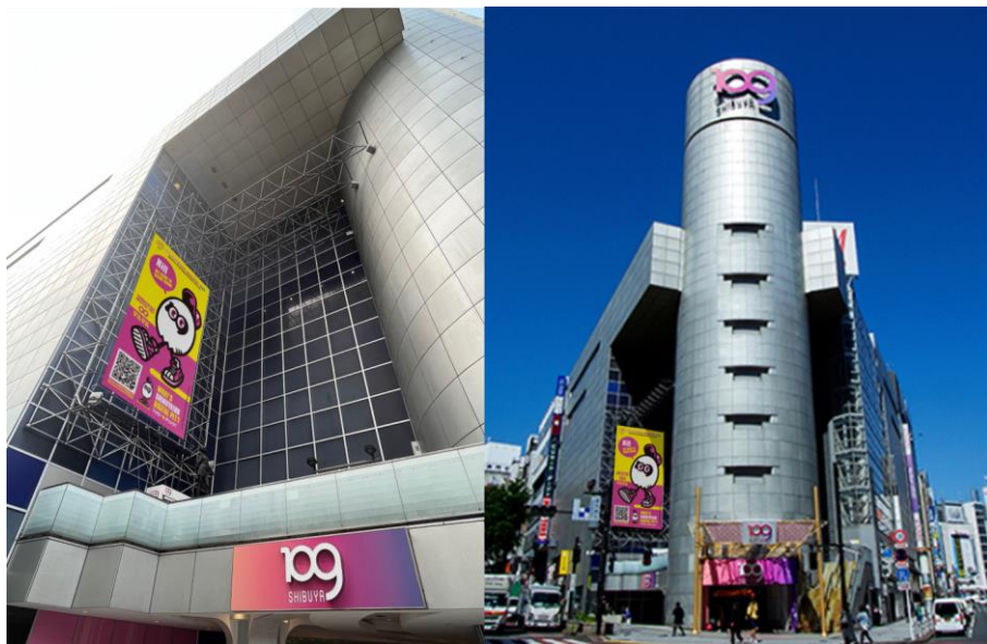
キャラクター「マルマル」壁面懸垂幕掲出イメージ