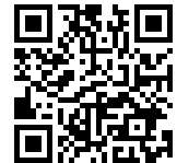
【公式】SHIBUYA109_Metaverse & NFT X (旧Twitter)： https://twitter.com/shibuya109nft

株式会社SHIBUYA109エンタテインメントは、世界のブロックチェーンをリードするWeb3ゲーミングメタバース『The Sandbox』と提携し、メタバース上に渋谷の街を再現した「SHIBUYA109 LAND」を開設いたします。「SHIBUYA109 LAND」では、当社のネットワークを活かしたアーティストやキャラクター等とのコラボレーションイベントの実施、オリジナルNFTの販売、ミニゲームの実施、メタバース上での大胆な広告展開など、メタバースだからこそできる新たな体験価値を提供していきます。