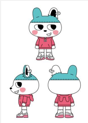
クリエイター よしだきよたか