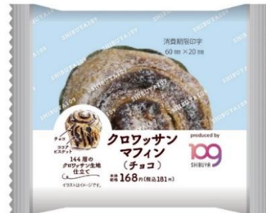
商品パッケージイメージ