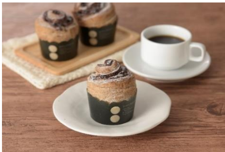
「SHIBUYA109 監修クロワッサンマフィン(チョコ)」(税込 181 円)

株式会社ローソン(本社:東京都品川区、代表取締役社長 竹増 貞信)、株式会社東急ストア(本社:東京都目黒区、代表取締役社長 大堀 左千夫)、株式会社 SHIBUYA109 エンタテイメント(本社:東京都渋谷区、代表取締役社長 石川 あゆみ)は、3社で共同開発した「SHIBUYA109 監修クロワッサンマフィン(チョコ)」(税込 181 円)を、7月11日(火)から、関東甲信越のローソン店舗および東急ストアで発売します。お客様に「わくわくするような楽しいお買い物体験をしていただきたい」という共通の想いのもと3社で初めて共同開発した商品です。