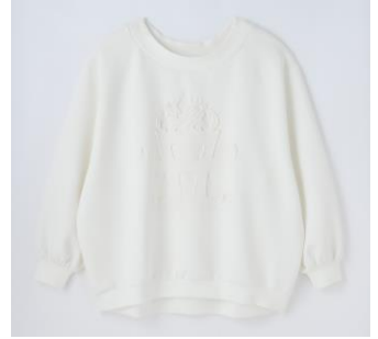
ROYAL PARTY エンボスロゴオフショルチュニック (全3種 ピンク,ブラック,オフホワイト) 各¥11,000