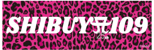
ノベルティステッカーイメージ

※ポップアップストア『ayumi hamasaki 25th Anniversary POPUP STORE』、一部店舗でのお買い物は対象外となります。