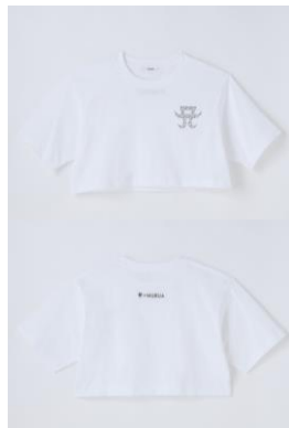
MURUA [ayumi hamasaki×MURUA] MONOGRAM A LOGO PRINT CROPPED Tシャツ (全2種 ブラック,ホワイト) ¥6,490