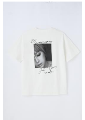
rienda ayumi hamasaki Line Stone Tシャツ (全1種 ホワイト) ¥7,150