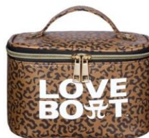
バニティーポーチ ¥3,800 (tax in)