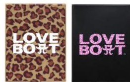
ミラー（2種） ¥2,500 (tax in)