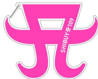
カラビナイメージ