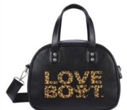
ボストンショルダーバッグ ¥5,800 (tax in)