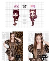
ポストカード3枚セット ¥900 (tax in)