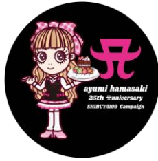
ノベルティコースターイメージ