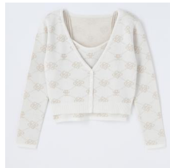
ROYAL PARTY パールストラップジャガードニットアンサンブル (全3種 ピンク,ブラック,オフホワイト) 各¥13,200