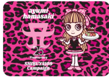
ノベルティランチマットイメージ