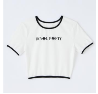
ROYAL PARTY MIXロゴバイピンクチビTシャツ (全3種 ピンク,ブラック,オフホワイト) 各¥5,390