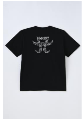
MURUA [ayumi hamasaki×MURUA] MONOGRAM A LOGO PRINT BIG Tシャツ (全2種 ブラック,ホワイト) ¥6,930