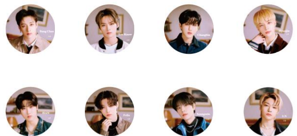
缶バッチ (全8種) /各¥650