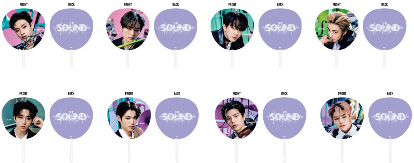
うちわ (全8種) /各¥800