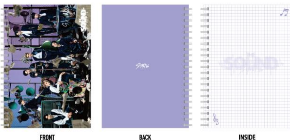
ノート (全1種) /¥1,500