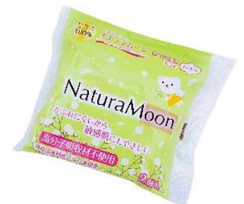
ナチュラムーンサンプルイメージ