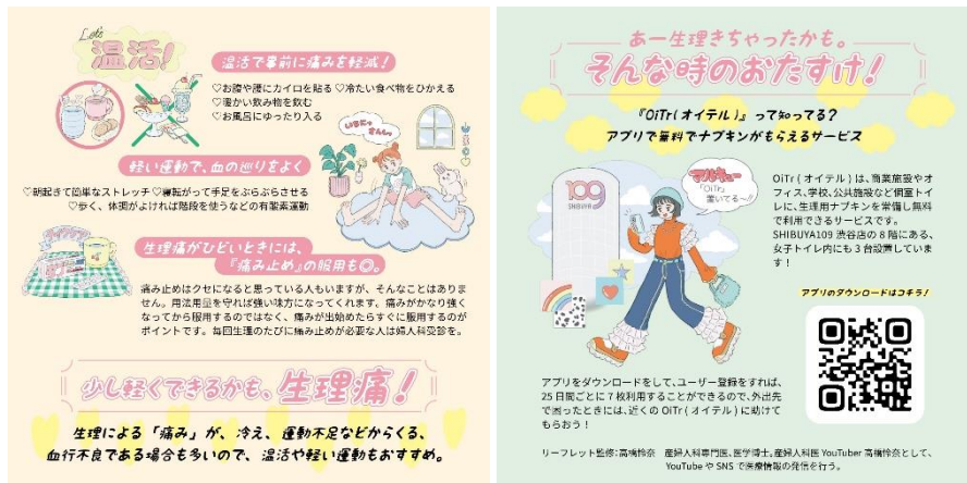
リーフレットイメージ（一部）