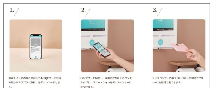
OiTr (オイテル) 使用方法