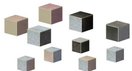
「PANECO®」でできたベンチイメージ