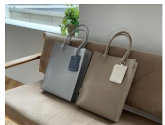
ノベルティイメージ