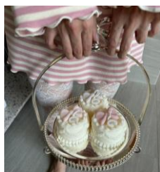
ノベルティイメージ