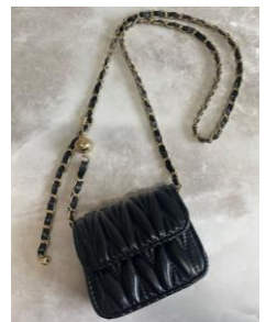
ノベルティイメージ