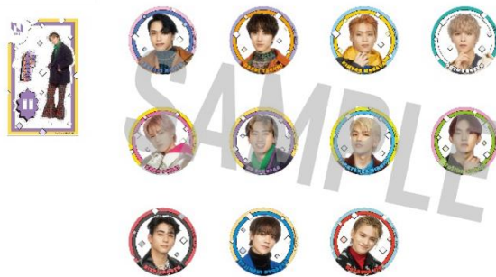
缶バッジ（ランダム） / ¥500