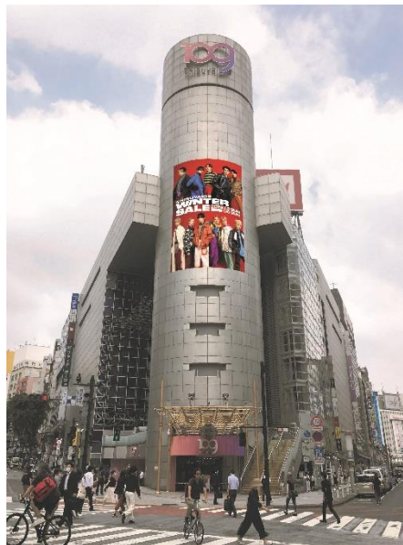
SHIBUYA109渋谷店装飾イメージ

SHIBUYA109公式YouTube： https://www.youtube.com/channel/UCpt3D-UVX_jj2MDFVM6V0bA