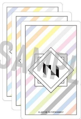
トレーディングカード（ランダム）3枚セット / ¥1,100