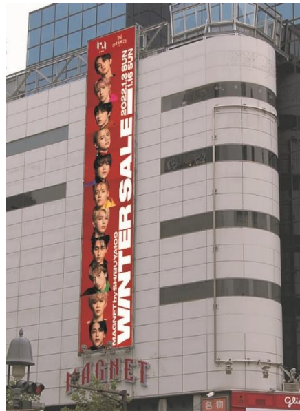
MAGNET by SHIBUYA109装飾イメージ