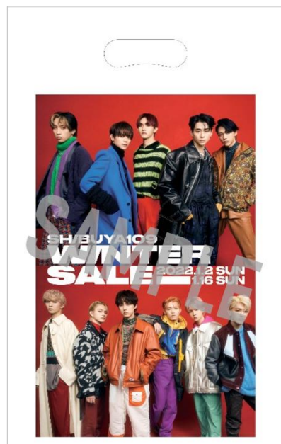
ショッパーイメージ

※東京・大阪・愛知の3都市で開催する『INI POP-UP STORE』でのお買い物は対象外となります。