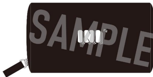
ポーチ / ¥1,800