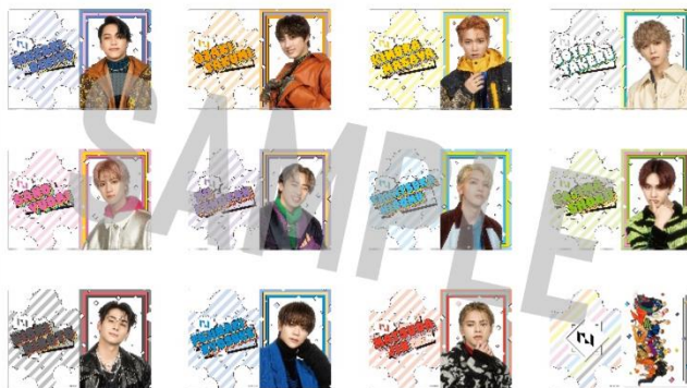
A4クリアファイル（ランダム） / ¥500