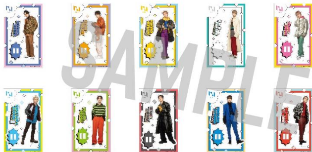
アクリルスタンド（ランダム） / ¥1,000