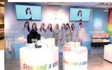
渋谷店 8F 展開例 「NiziU」(2020年11月)