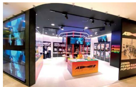
渋谷店 B1F 展開例 「ATEEZ」(2020年9月)