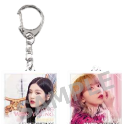
アクリルキーホルダー (全15種/ランダム) ¥500