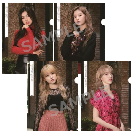
クリアファイルA4サイズ (全15種/ランダム) ¥500