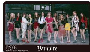
モバイルバッテリー ¥4,000