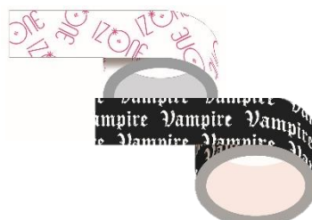
マスキングテープ (2本セット) ¥1,200