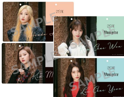
ネームプレート (全12種/ランダム) ¥550