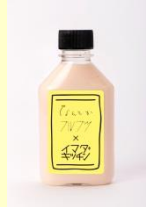
<なんとかフルウツ> ロイヤルミルクコーヒーいちご 420円