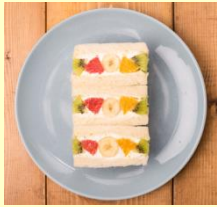
<フツウニフルウツ> フツウニフルウツ 1個420円

「フツウニフルウツ」や系列ブランド「なんとかプレス」 「なんとかフルウツ」で販売されている商品も一部販売いたします。