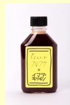
<なんとかフルウツ> 時間出しコーヒーぶどう 420円