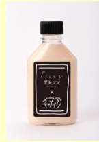
<なんとかプレス> ロイヤルミルクコーヒー（加糖・無糖）420円