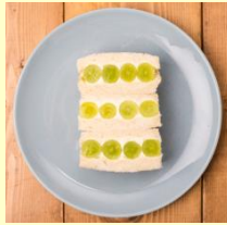
<フツウニフルウツ> シャイニー 1個450円