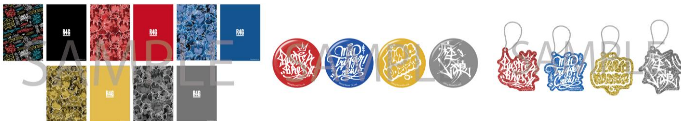
クリアファイル（全5種）各¥350