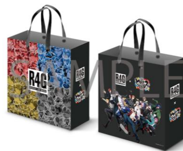
ショッパーイメージ

《ショップ名》 ヒプノスマイクPOP UP STORE PRODUCED BY R4G