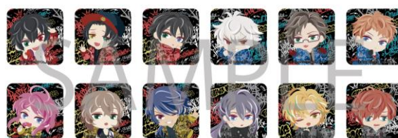
SD アクリルマグネット[ガチャ商品]（全12種／ランダム） 1回¥400（税込）