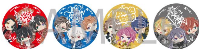
SD Div 缶バッジ（全4種）1個¥500