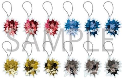
アクリルキーホルダー (全 12 種/ランダム) 1 個¥700