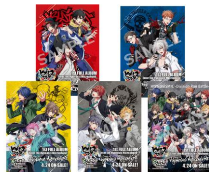
ポストカードイメージ

※お渡しするオリジナルポストカード（全5種）はランダム配布となります。各店舗なくなり次第終了となります。