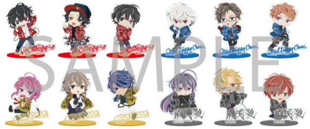
SD アクリルスタンド (全 12 種/ランダム) 1 個¥800