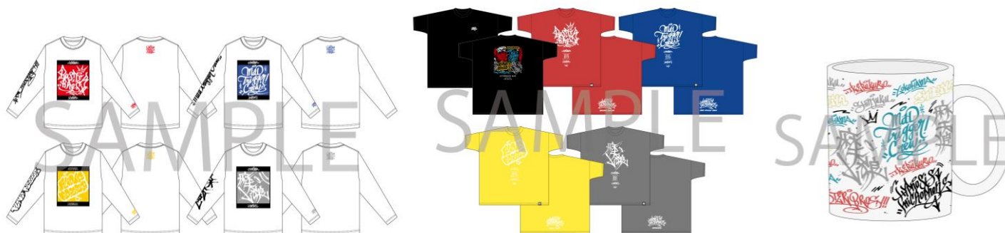
タギングロングTシャツ（全4種／S,M,L） 各¥5,800