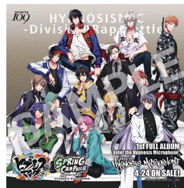
ステッカーイメージ