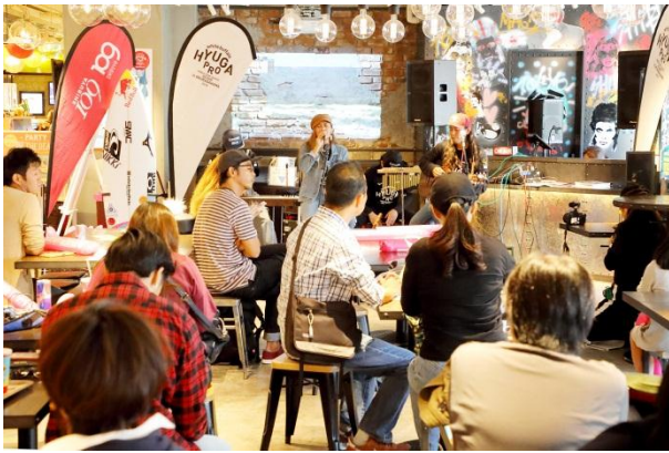
ライブ中継イベント