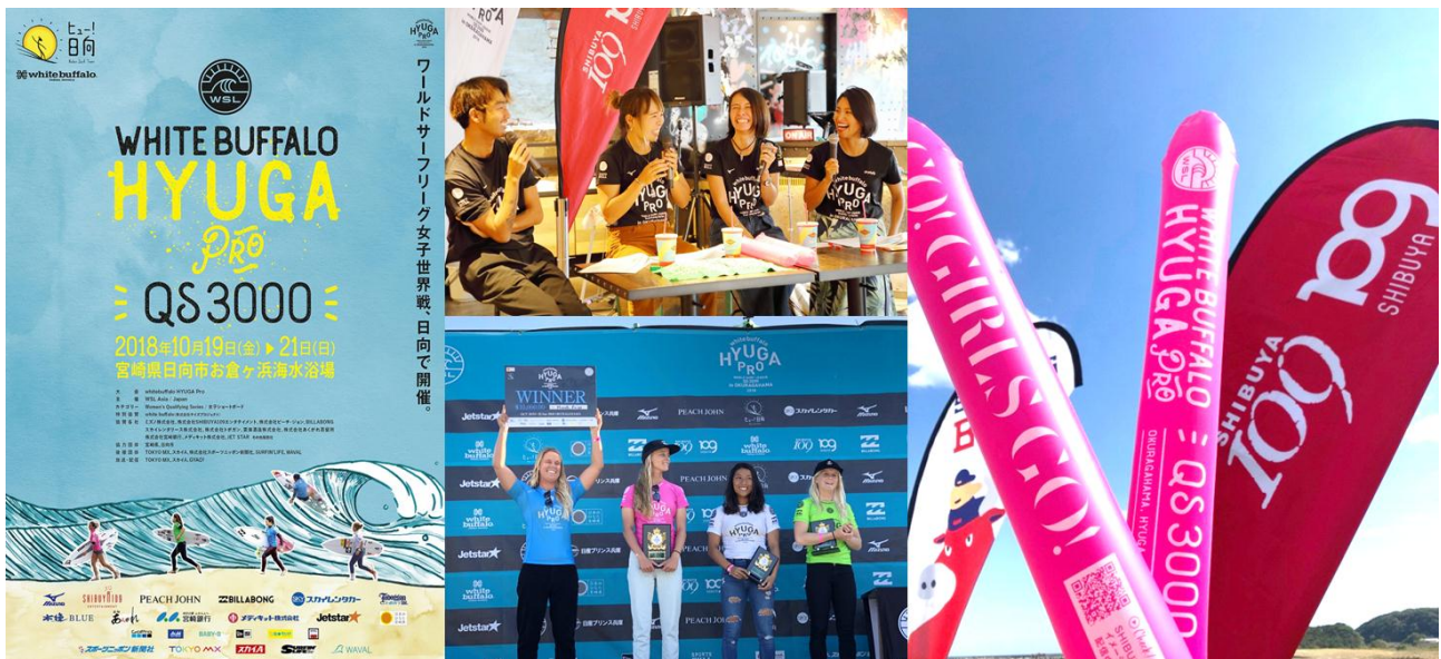
「white buffalo HYUGA PRO QS3000」大会の様子

若者を輝かせ、夢や願いを叶えるため、商業施設運営に留まらない事業展開を行う株式会社 SHIBUYA109 エンタテインメント(本社：東京都渋谷区、社長：木村 知郎/以下、当社)では、2018年10月19日(金)から21日(日)にかけて、宮崎県日向市で開催された「white buffalo HYUGA PRO QS3000」(開催地：宮崎県日向市)第3回大会(以下、今大会)に協賛。大会へのサポートを通じて、世界を目指し輝く女子プロサーファーを応援しました。