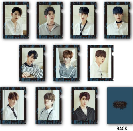
UP10TION クリアファイル (全 10 種) 各¥600