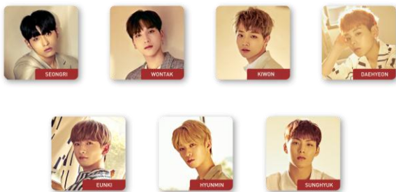
RAINZ アクリルマグネット (全 7 種/ランダム) 各¥500