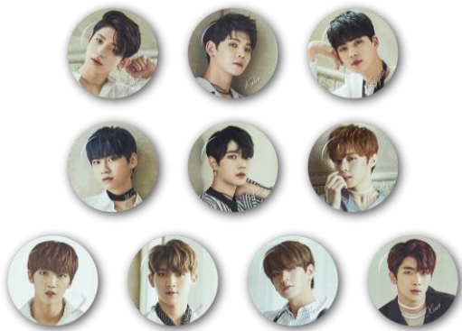
UP10TION 缶バッジ (全 10 種/ランダム) 各¥300

<主な取り扱いアイテム> ※価格は全て税込み、下記商品はすべて SHIBUYA109 限定アイテムとなります。