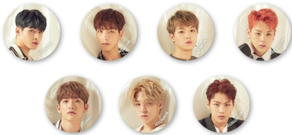
RAINZ 缶バッジ (全 7 種/ランダム) 各¥300