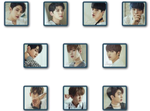
UP10TION アクリルマグネット (全 10 種/ランダム) 各¥500