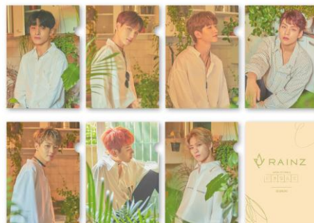
RAINZ クリアファイル (全 7 種) 各¥600