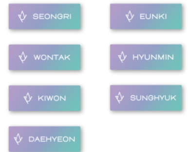
RAINZ アクリルネームバッジ (全 7 種) 各¥600