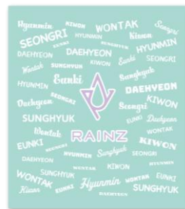
RAINZ ハンドタオル ¥1,300