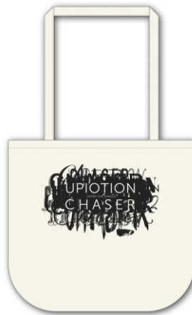
UP10TION トートバッグ ¥1,600