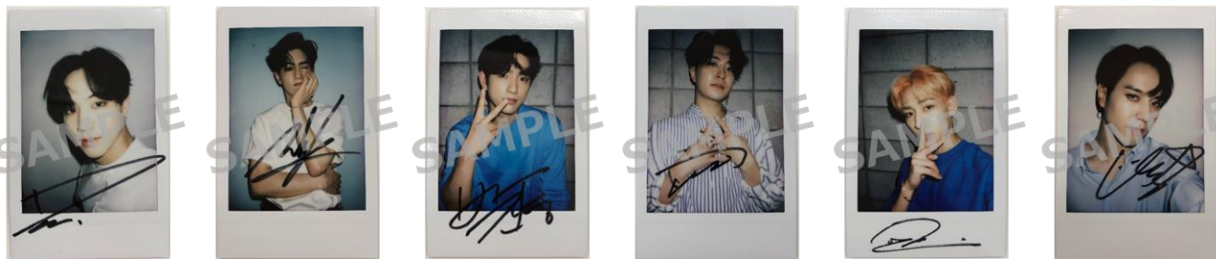
サイン入りポラ写真 イメージ

「GOT7」のSHIBUYA109限定アイテムを取り扱うポップアップストア「GOT7 POPUP STORE "LOVE LOOP"」にて、¥10,000（税込）以上ご購入の方々の中から抽選で計24名様に「メンバーごとのサイン入りポラ写真」をプレゼントいたします。応募方法などの詳細は後日特設サイト、SNS等で発表いたします。