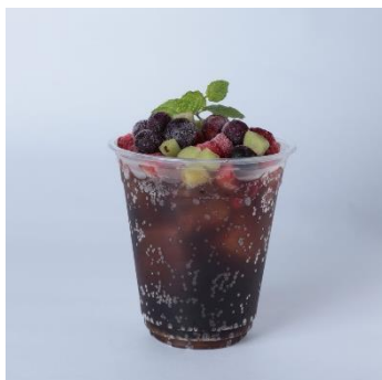
フローズン・フルーツ KARMAソーダ (SHIBUYA PARLOR)