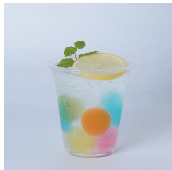
# SUMMER VIBES カラフルベリー・ソーダ (Theぎよるびー)