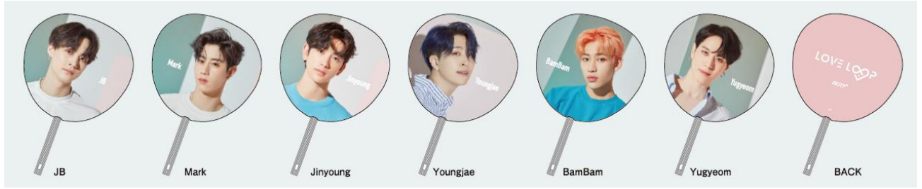
うちわ (全6種) 各¥550