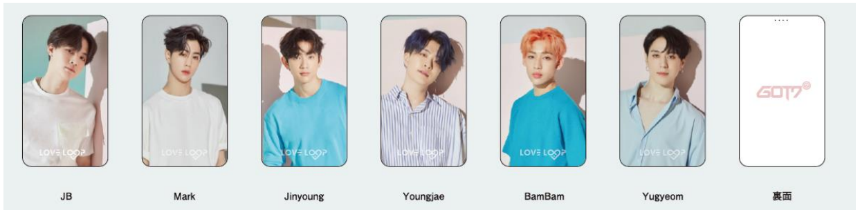
モバイルチャージャー (全6種) 各¥4,500