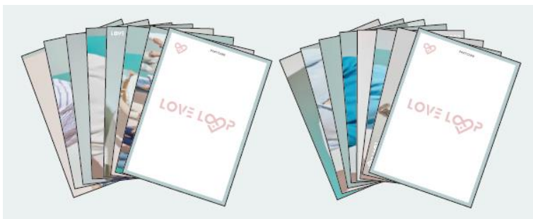
ポストカードセットA/B (各7枚入り) 各¥1,200 (A : JB・Mark・Youngjae・GOT7) (B : Jinyoung・BamBam・Yugyeom・GOT7)