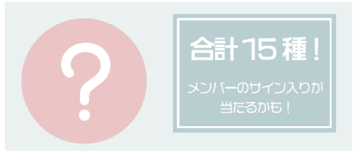
ランダム缶バッチ 1個¥500