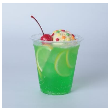
AGASE メロン・ソーダ (らんまん食堂)