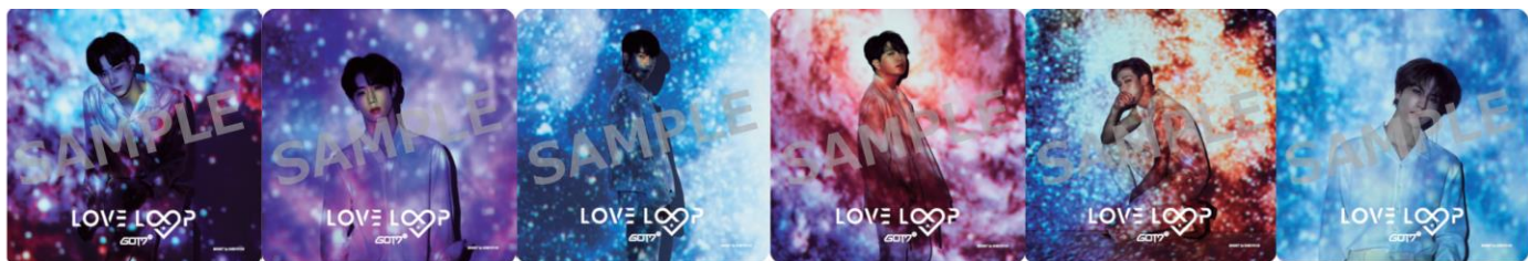
コースターイメージ