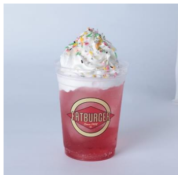
LOVE LOOP クリーミー・ソーダ (FATBURGER)