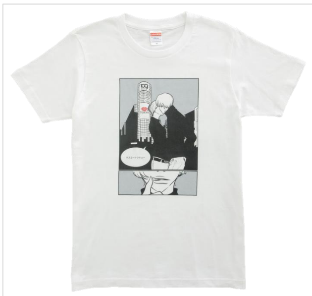
ますだみく 【kiss me tokyo】