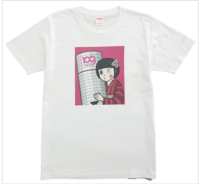
橋爪 悠也 (はしづめ ゆうや) 【TOKYO CYLINDER KISS】