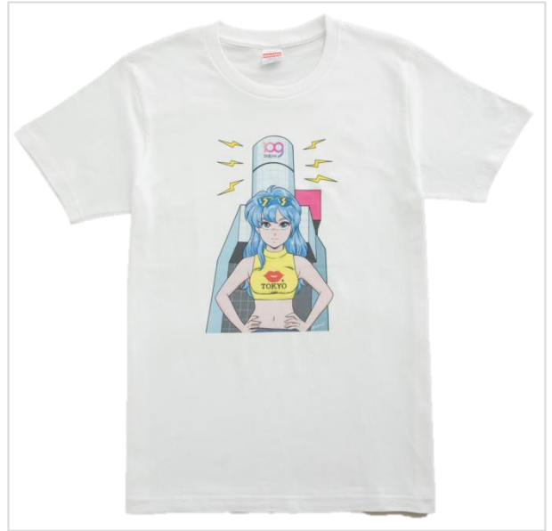
鎌田 かまを（かまだ かまを） 【にゅーぜねれいしょん】