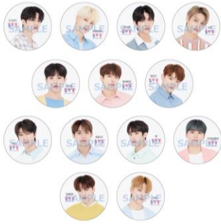
缶バッジver.1 （全13種/ランダム）1個¥600