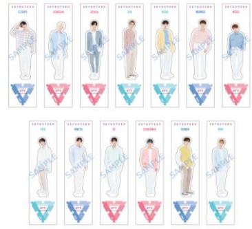
ペーパースタンド （全13種）各¥800