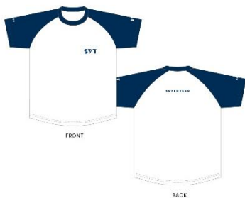
ラグランTシャツ （サイズ：L/XL）各¥4,300