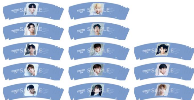
＜オリジナルスリーブイメージ＞

《価格》 コラボドリンクメニューは全て¥850（税込）です。 ※オリジナルスリーブ、メニューは各日無くなり次第終了となります。 ※混雑時は時間制限・入場規制を行う場合がございます。 ※詳細は追ってMAGNET by SHIBUYA109ホームページにてご案内いたします。