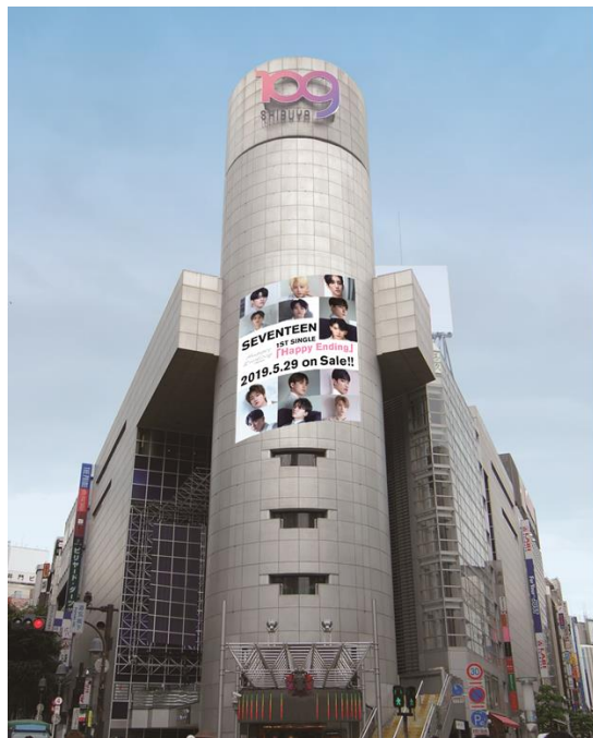
<シリンダーイメージ>