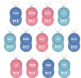
ボイスチャーム （全13種/ランダム）¥1,300