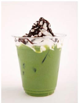
チョコをちょこっと ときめきグリーン (ご馳走そば そら)