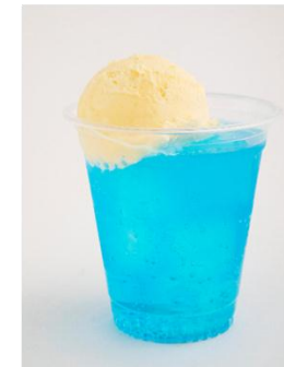
シュワシュワスカイブルー (The ゐるびー)