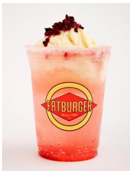
キュンキュンストロベリーサイダー (FATBURGER)