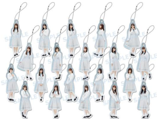
アクリルキーホルダー（全20種／ランダム） 1個¥600+税