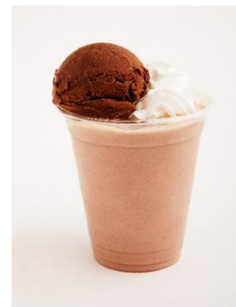
CHOCOLATEFUL LOVE (らんまん食堂)