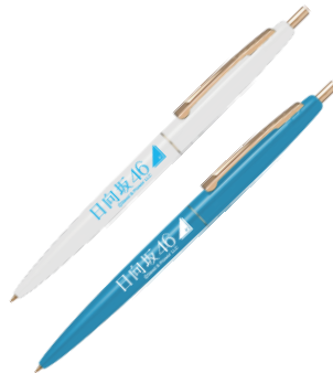
ボールペン（全2種）各¥600+税