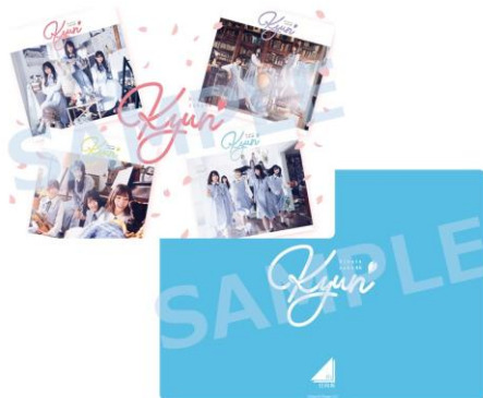
B5 下敷き ¥500+税