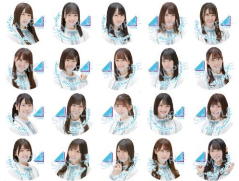
コースターイメージ

MAGNET by SHIBUYA109の7階飲食フロア「MAG7（マグセブン）」では、本キャンペーンに合わせた「日向坂46」コラボカフェを開催。「日向坂46」のメンバーが考案したオリジナルメニューが登場するほか、期間中は、カフェ内にて日向坂46 POP UP STORE限定アイテム用にメンバーが描き下ろした手書きイラストを展示した特別装飾、プロモーションビデオの放映など7階フロアが「日向坂46」一色となります。また、コラボメニューを1品ごとに先着でオリジナルコースター（全20種／ランダム）をプレゼントいたします。※オリジナルコースターは各店舗なくなり次第終了となります。※毎週水曜日から金曜日の20：00以降は、カフェ内にてインターネットラジオの公開収録があるため、BGMが変更となります。予めご了承ください。（コラボメニューの販売は行っております）