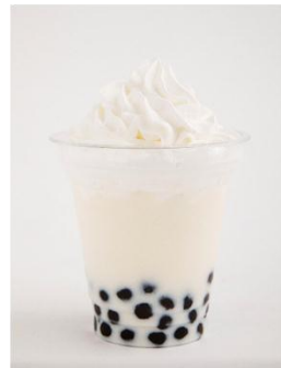
もくもくタピオカ (おにぎり Bar 渋谷園)