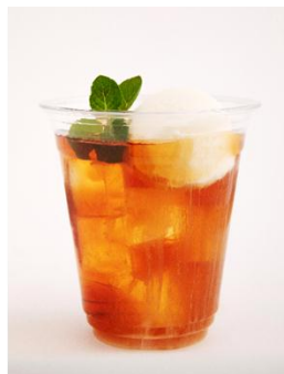
チーズがアイスなら (SHIBUYA PARLOR)