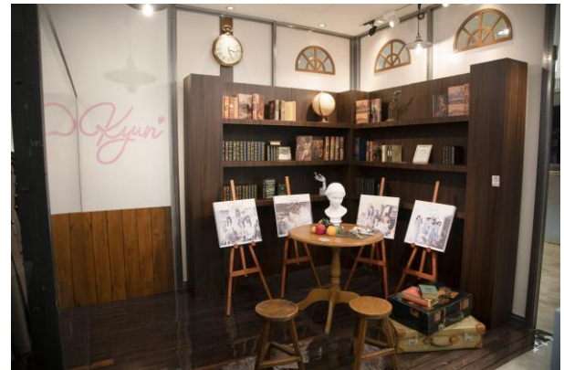
日向坂46 POP UP STORE（渋谷）

《主な取り扱いアイテム》※下記アイテムは、3月26日（火）から取り扱う本ストア限定アイテムです。価格はすべて税抜きです。