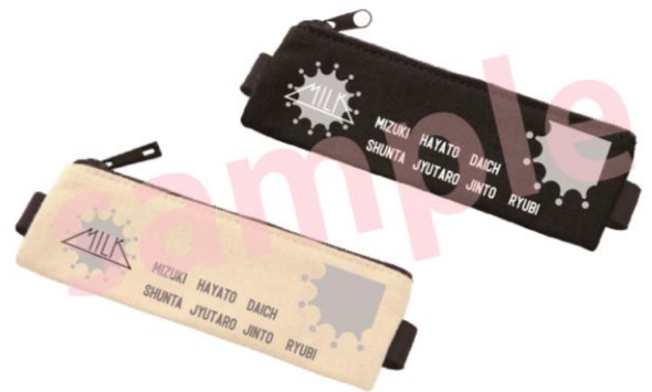
<SHIBUYA109 限定> ペンケース (白: 東京 ver./黒: 大阪 ver.) 各 ¥1,000