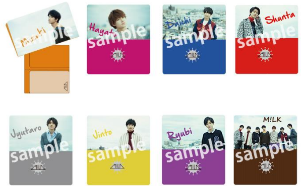
<SHIBUYA109 限定> チケットファイル (全 8 種/ランダム) 1 枚¥800