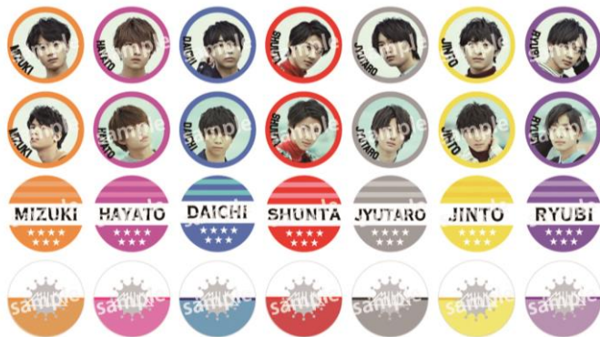
<SHIBUYA109 限定> 缶バッジ (全 28 種/ランダム) 1 個¥500