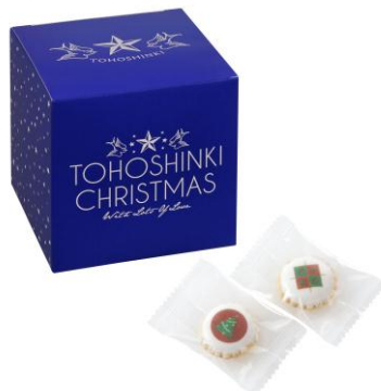
《SHIBUYA109 限定》※12月3日（月）～発売 アイシングクッキー（ステッカー付き） ¥800 ※ステッカー1枚（ランダム3種）