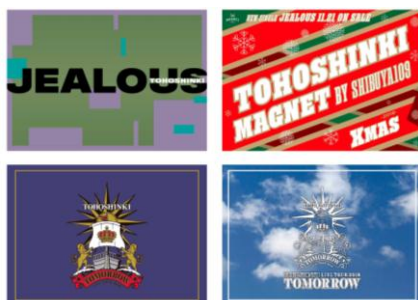
フード注文ノベルティ ランチョンマット (全4種/ランダム)