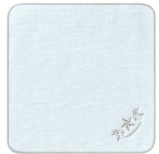
《SHIBUYA109 限定》 ハンドタオル ¥1,300