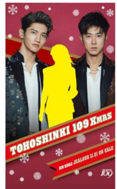
※フオトスポットイメージ

※SHIBUYA109・MAGNET by SHIBUYA109は仕様異なります。