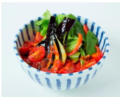
ご馳走そば そら Jungle そば / ¥ 1,000