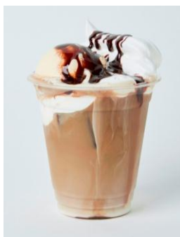
らんまん食堂 TOMORROW ラテ / ¥ 650