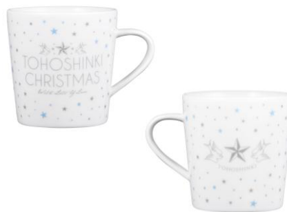
《SHIBUYA109 限定》 マグカップ ¥1,600