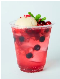
SHIBUYA PARLOR Sound of love / ¥650