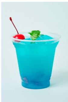
おにぎり Bar 渋谷園 Song of love / ¥650

おにぎりBar 渋谷園／ご馳走そば そら／The ぎよるびー／SHIBUYA PARLOR／FATBURGER／らんまん食堂 《コラボメニューイメージ》※価格はすべて税込です。