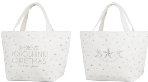
《SHIBUYA109 限定》ミニトートバッグ ¥2,300