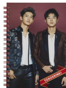
《SHIBUYA109 限定》※12月3日（月）～発売 リングノート ¥1,200