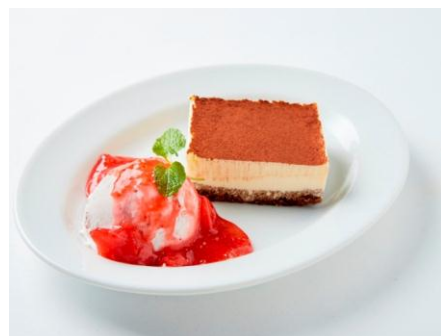
The ぎよるびー T ラミス / ¥ 900