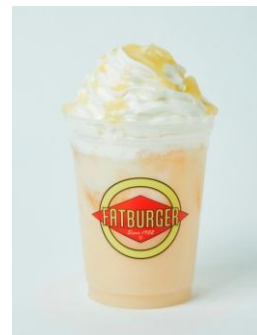
FATBURGER 明日来るシェイク / ¥ 800