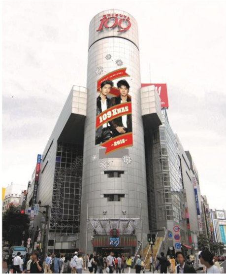
SHIBUYA109 シリンダーイメージ

渋谷の象徴ともいえるSHIBUYA109外観（通称：シリンダー）のクリスマスイルミネーションをはじめ、全国5施設のSHIBUYA109屋内外に、今回のイメージモデル「東方神起」のオリジナルキャンペーンビジュアルを掲出いたします。