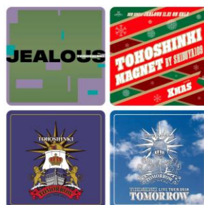
ドリンク注文ノベルティ コースター (全4種/ランダム)