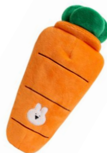
にんじんペンケース ¥1,600