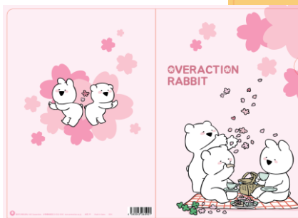
クリアファイル 各¥300