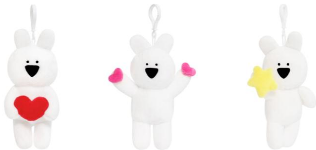
かばん付けぬいぐるみ 各¥900