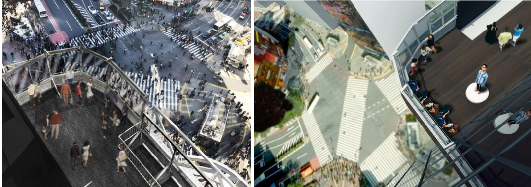
▲展望台「CROSSING VIEW」／フォトサービス「CROSSING PHOTO」撮影イメージ

「MAG's PARK」内に、スクランブル交差点を一望できるフォトスポット、「CROSSING VIEW（クロッシング ビュー）」を設置します。