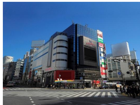
※画像は一部イメージであり、変更になる場合があります