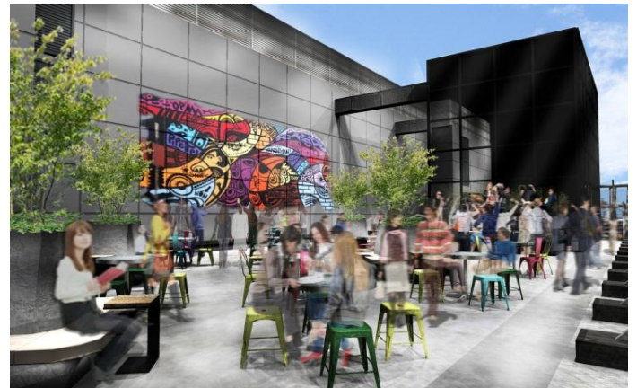
屋上詳細イメージ