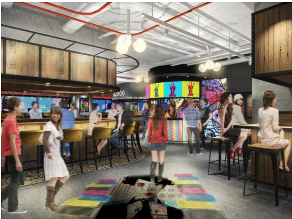
7階フロアイメージ