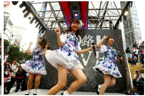
東京flavor (アイドル部門、予選1位)