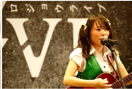
マヨエ (オールジャンル部門、予選2位)