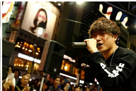
H!dE (ゲストアーティスト)