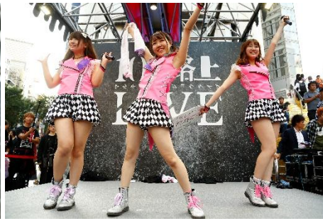
LOCK ON LAUGH (アイドル部門、予選2位)