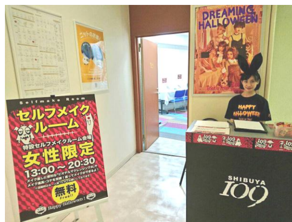
ハロウィン仮装専用メイクルーム (SHIBUYA109 8階)