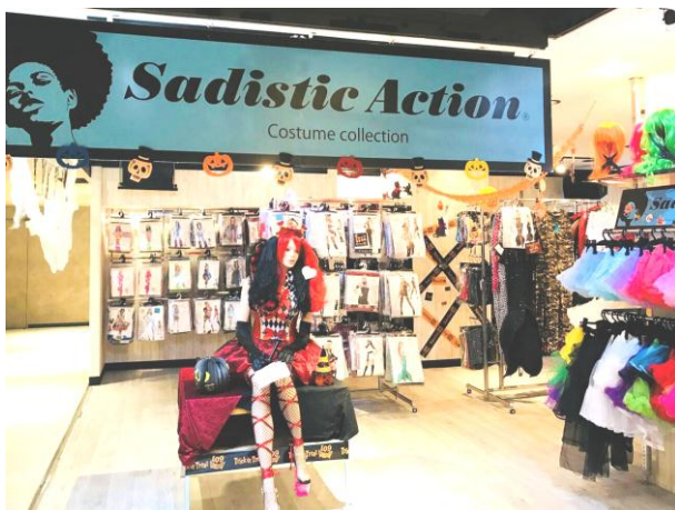
ハロウィンコスチューム専門店 「Sadistic Action」(109MEN'S 7階)

10月31日（火）の渋谷は毎年多数のコスチューム衣装を着た人たちが集まっており、SHIBUYA109・109MEN'Sでは、ハロウィンコスチュームを取扱う専門店をオープン。さらにハロウィン当日となる10月31日（火）には、ハロウィン仮装専用のフィッティングルームや、メイクコーナーの設置もいたします。