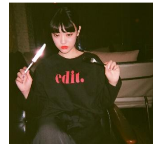
#こうこりあさんぽ.com

※IMADA MARKETとは…“未だ”世に出ていない個人・ブランド・スタートアップ企業を対象に、SHIBUYA109が設定したテーマに沿って、アパレルだけでなく雑貨やアートなど既存の枠組みにとらわれないMD構成を実現。1テーマにつき1~20ブランドを導入し、約1ヶ月サイクルで展開する新たなインキュベーションプラットフォームです。リアル店舗とECサイトの運営を一括で行うシステムを活用する販売サポートのほか、SHIBUYA109オウンドメディアを使用した販売促進活動など、各方面からブランド認知拡大の支援も行き、出品しやすい環境を整えております。