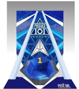
フォトスポットイメージ