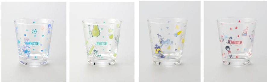
※SHIBUYA109 限定商品 樋口大輔先生描き下ろし ちびっするグラス(全 4 種)各¥1,600