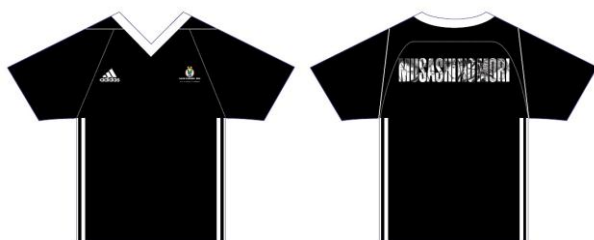
桜上水トレーニングユニフォーム(上) 武蔵森トレーニングユニフォーム(下) 各¥5,600