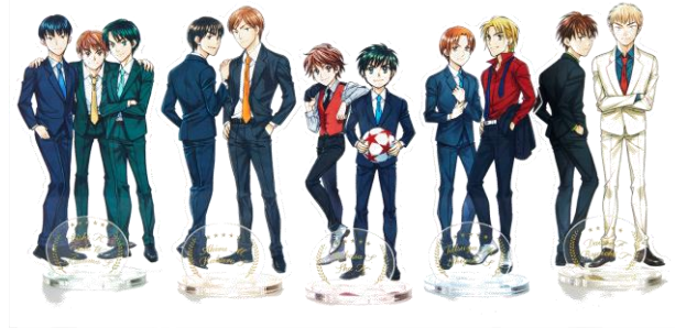
※SHIBUYA109 限定商品 アクリルスタンド(全 5 種)各¥1,500