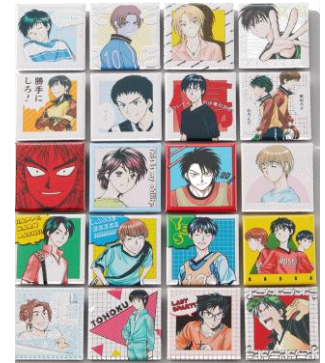
※SHIBUYA109 限定商品 トレーディングスタンプ缶バッジ (全 20 種/ランダム)各¥400