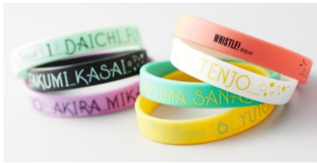
※SHIBUYA109 限定商品 キャラクター応援ブレス(全 8 種)各¥1,400