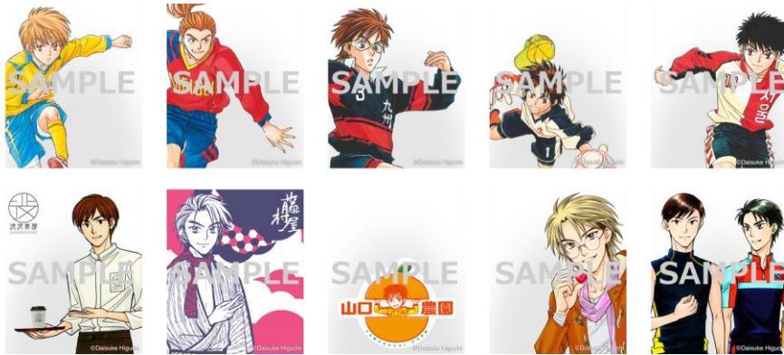
撮影フレームデザイン イメージ