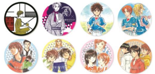
コースターイメージ

8階「SBY」のカフェスペースに、「ホイッスル！」登場キャラクターの渋沢克朗が店主を務める喫茶スペース「渋沢茶房」がオープンいたします。主人公・風祭将をはじめ、水野竜也、佐藤成樹などメインキャラクターたちをイメージしてつくられたオリジナルタピオカドリンクや、期間中に誕生日を迎えるキャラクターのスペシャルなコラボドリンクをお楽しみください。対象ドリンクをご注文いただいた方には「渋沢茶房オリジナルコースター」(全8種/ランダム)を1枚お渡しいたします。さらに店内のテーブル席も期間中は「ホイッスル！」仕様に装飾いたします。