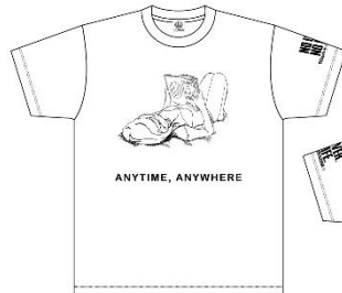
D 2015.09.13@KOBE WORLD HALL ver.