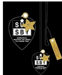
渋谷店限定ピックネックレス