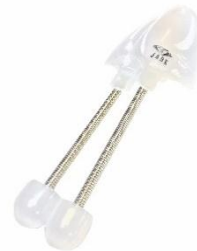
オリジナルシューズキーパー