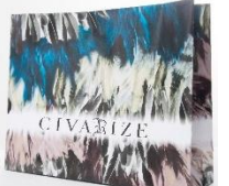
限定シーズンショッパー