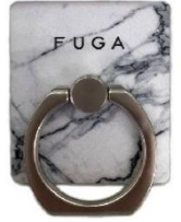
オリジナルバンカーリング