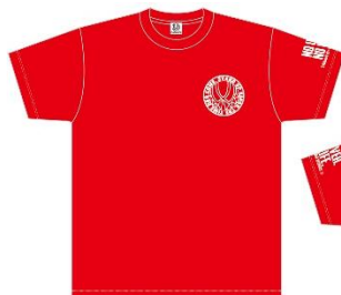
C 2015.01.10@YOKOHAMA ARENA ver.