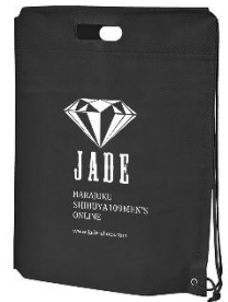
オリジナルシューズバッグ