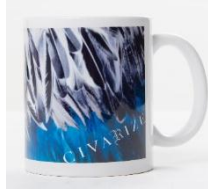
オリジナルマグカップ