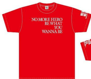
A 2013.02.28@Zepp DiverCity ver.